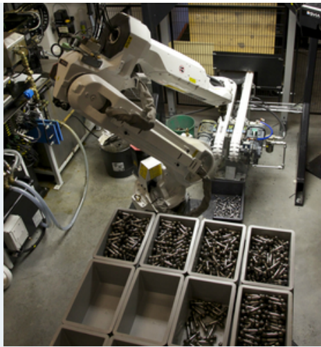
Sunfab plockade under 2012 hem tillverkningen av kolvärmnen. Här används roboten i processen att induktionshårda kolvens vitala delar.

– Sunfabs senaste investering är en ny rundslip som slipar lagerlägen på samtliga axlar. En investering på ca 3 milj kr. Den har betydligt högre kapacitet och driftsäkerhet än den gamla slipen som den nu kommer att ersätta, berättar Leif. Den nya rundslipen håller nu på att köras igång och ska under Q1 2015 vara i full automatiserad drift.